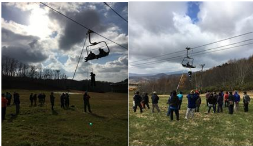
全スタッフ参加のリフト救助訓練風景